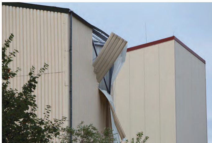
Hinter dem Loch in der Außenwand stand das zu befüllende Silo

einen Zeitraum von etwa 2 Stunden befüllt. Beim Befüllen wird zwischen dem Silo und dem anliefernden LKW-Silozug eine Schlauchverbindung hergestellt, die es dem anliefernden LKW ermöglicht, die Kieselsäure mit hohem Druck in das Silo zu befördern. Im Normalfall sind Sicherheitsmechanismen angebracht, die den Druck bzw. die Füllung des Silos regeln, damit es nicht zu einer Überfüllung oder zu viel Druck im Silo kommen kann. Am Dienstagnachmittag, so die ersten Einschätzungen, muss dieser Sicherheitsmechanismus ausgefallen sein, so dass ein Überdruck in dem Silo entstehen konnte. Durch den gewaltigen Druck zerbarst die Schweißnaht am oberen Ende des Silos, mit einem riesigen Knall riss das Silo auf, zerstörte Teile der etwa 12 Meter hohen Blechwand sowie des Daches der Betriebshalle und schleuderte die Kieselsäure in die Luft.