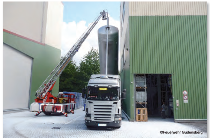
Überall Staub bei den Hilfsarbeiten