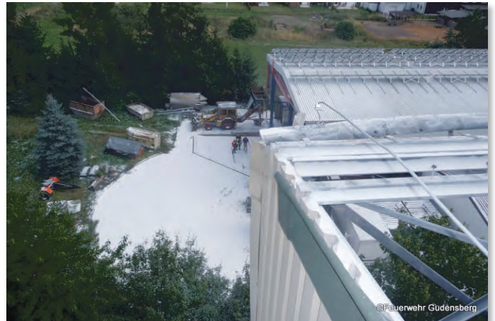
Das ganze Ausmaß von oben