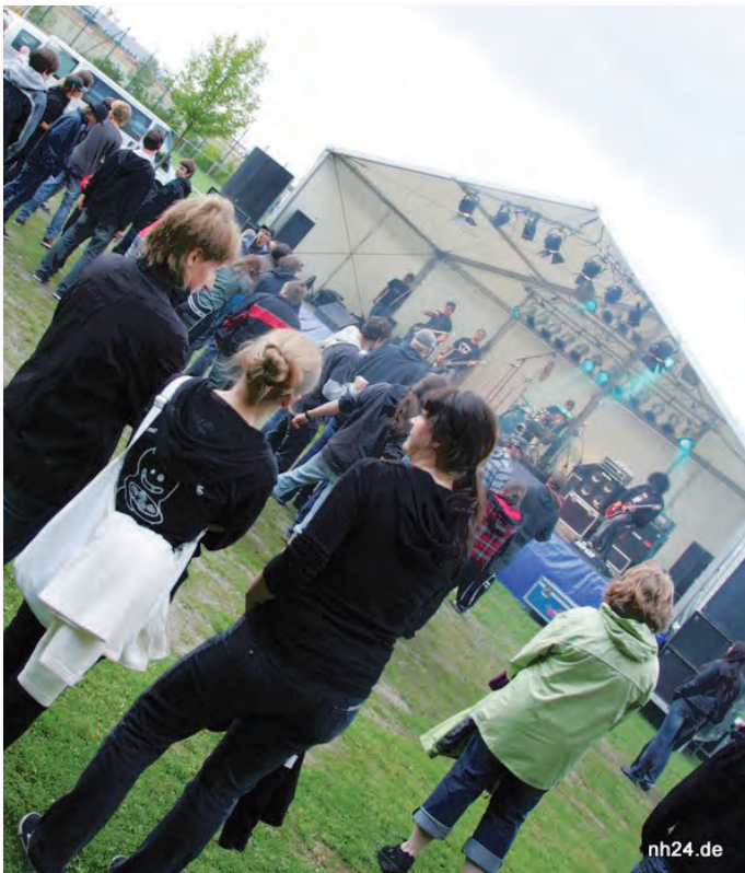
„Rock am Hahn“-Festival im vergangenen Jahr

Edermünde (pm/beg/rs). Geplant, geguckt und jetzt geht's richtig los! Das Line-up für das 5. „Rock am Hahn“-Festival am 28. August 2010 steht und die Tickets sind im Vorverkauf erhältlich. Zum 5. Geburtstag vom „Rock am Hahn“-Festival soll es wieder ein volles Programm an Bands, Musik und Festivalstimmung in „Gartenatmosphäre“ geben! In diesem Jahr dabei sind: Fullax, Nation Paradox, Spit, Wild Night, Signalis, Männerurlaub und last, but not least Dezemberkind. Auch ein Antrag auf schönes Wetter wurde an entsprechender Stelle abgegeben.