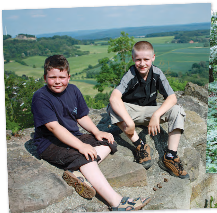
Die beiden Jungs sind hier bei einer Führung auf dem Schlossberg. Viel Spaß werden die Kinder auch bei dem Nachmittag am Odenberg haben.

17. Oktober Treffpunkt: Skulptur der Großen Frau 14 Uhr Historischer Stadtrundgang mit Kunst für Frauen, Brigitte Brommer